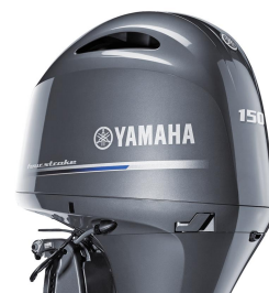
Remote control model (ET)

Et attraktivt udseende er ikke den eneste fordel ved denne funktionelle motorhætte. Den er designet til at opsamle og aftappe vand med maksimal effekt, hvilket giver en mere jævn sejlads, mindre korrosion og forlænger motorens levetid.